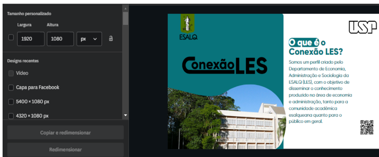
Imagem meramente ilustrativa e designada no aplicativo Canva, demonstrando as configurações exatas a serem utilizadas para a formatação da imagem.